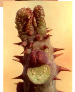
写真:松村 良「冬芽と葉痕」より